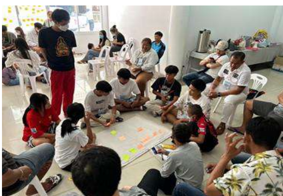
๙.โครงการจัดงานประเพณีแห่เทียนพรรษา