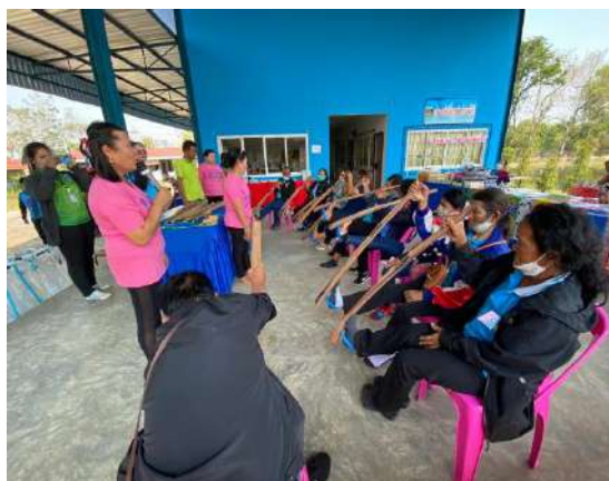
๘.โครงการครอบครัวสัมพันธ์